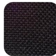
0709 106 Rallye 94,00 € TTC