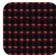
QUARTET ROUGE 205-309 GTI 78,00 € TTC