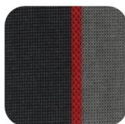
RAMIER 205-309 GTI 78,00 € TTC