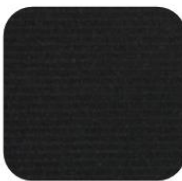
NOIR CÔTELÉ 205-309 GTI 64,00 € TTC