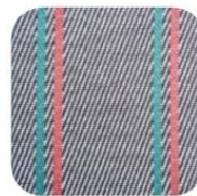
205 ROLAND GARROS 90,00 € TTC