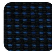
QUARTET BLEU 205-309 GTI 90,00 € TTC