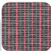
BIARRITZ 205-306 GTI 90,00 € TTC