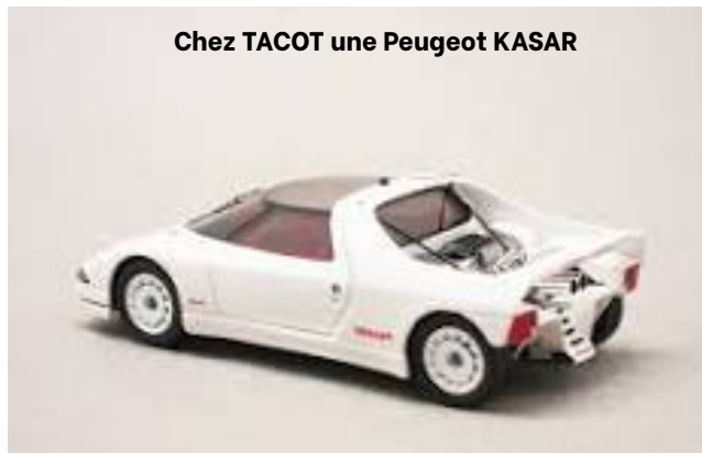
Chez TACOT une Peugeot KASAR